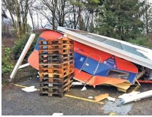
Die Überreste des Wohnwagens.

BERN. Die heftigen Schneefälle in der Region Grenchen sind der mobilen Kommandozentrale des örtlichen Zivilschutzes zum Verhängnis geworden. Die weisse Pracht begrub am Weihnachtswochenende einen ausgedienten Wohnwagen, der mit fünf Arbeitsplätzen, Strom- und Kommunikationsanschlüssen zur Zentrale umfunktioniert worden war, samt dem Unterstand unter sich. Die Zivilschützer suchen nun einen neuen Wohnwagen für ihre Einsätze.